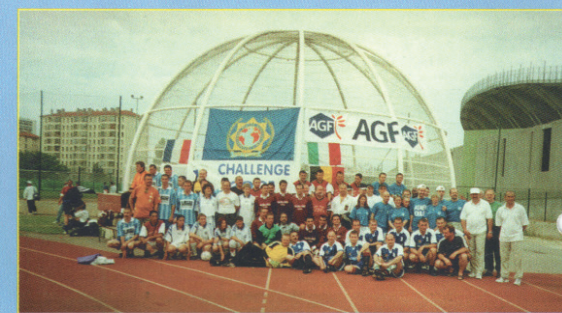
Drużyna IPA na stadionie w Marsylii