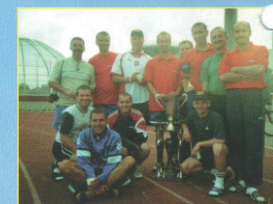
Policjanci IPA z Radomia i Plocka na tle pucharu przedchodniego

Wydawca: Sekcja Polska Międzynarodowego Stowarzyszenia Policji IPA, Poznań Adres Redakcji: 18-300 Zambrow, ul. Wąska 14, tel. Redaktora Naczelnego: 0-602 526 304, WSPol. 745 50 89 MSWiA Adres do korespondencji: Wyższa Szkoła Policji