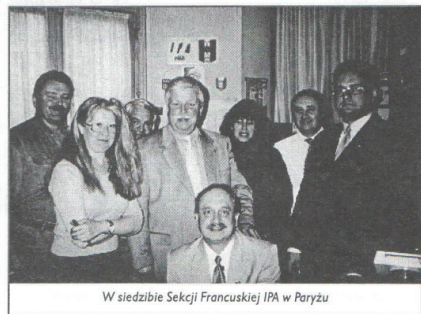
W siedzibie Sekcji Francuskiej IPA w Paryżu

21 grudnia, tradycyjnie lecz tym razem w „Teatralnej” spotkaliśmy się w licznym gronie, aby złożyć sobie życzenia świąteczne i noworoczne, podsumować rok, a także przyjąć nowych Zasłużonych dla IPA SP.