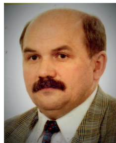
Koleżanki i koledzy – członkowie IPA, zasłużeni dla naszego Stowarzyszenia oraz wszyscy jego sympatycy i nasi przyjaciele!

Ponieważ rok 2018 jest dla nas rokiem jubileuszowym, to 20 rok oficjalnego istnienia Regionu IPA Radom, na zebraniach naszych członków dyskutowaliśmy nad sposobami jego uczczenia. W sierpniu uchwałą Prezydium powołano Komitet Organizacyjny Obchodów 20-lecia Regionu IPA Radom. Jego członkowie przystąpili natychmiast do prac nad ich organizacją. Jednym z pomysłów było uwiecznienie historii Regionu wydaniem publikacji i właśnie stąd jest ten tekst.